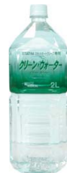
STATIM 専用クリーンウォーター