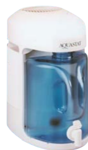
蒸留水精製器 アクアスタット

品番 W10120S サイズ L406×W245×H384 製造能力 約5時間30分で4L 電源 110V・50/60Hz・750W 製造元 SciCan